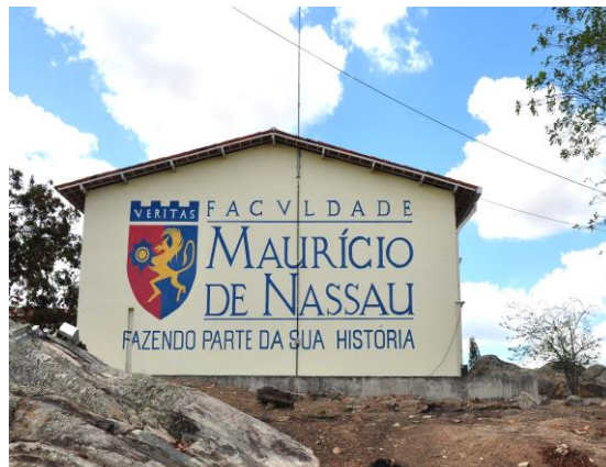
FIGURA 8. Vista geral da fachada da FACULDADE MAURÍCIO DE NASSAU, em Caruaru (PE).