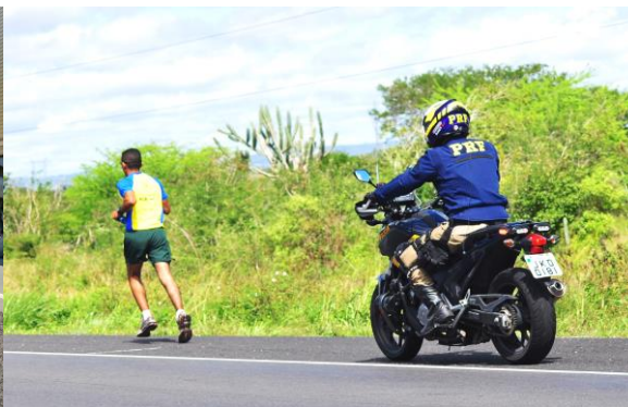
Figura 3 - Motoqueiro da Polícia Rodoviária Federal dando cobertura ao atleta próximo ao município de Lajedo (2014).