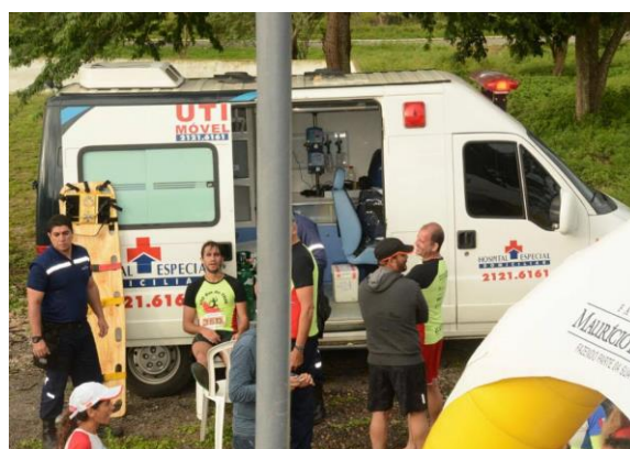
Figura 4 - Atleta em atendimento ao final da prova na edição de 2015.

Outra parceria importante no que tange a segurança, a saúde e o bem-estar dos participantes é aquela que firmamos com o Hospital Especial, para casos de emergência. Todos os atletas, equipes e apoios terão o contato direto da UTI móvel que estará, alternadamente, em pontos estratégicos do percurso.