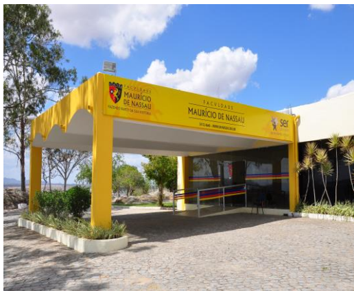
FIGURA 7. Entrada principal da FACULDADE MAURÍCIO DE NASSAU, em Caruaru (PE), local da largada dos 100 km DO FRIO 2016.

Em 2017, a chegada da prova será no Campus Caruaru da Faculdade Maurício de Nassau, que contribuirá com a sua estrutura física (estacionamento, área da lanchonete e banheiros).