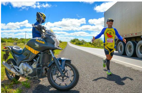
Figura 2 - Motoqueiro da Polícia Rodoviária Federal garantindo a segurança dos atletas durante os 100 km DO FRIO (2014), próximo ao município de Cachoeirinha.

Em todas as edições dos 100 km DO FRIO a POLÍCIA RODOVIÁRIA FEDERAL (PRF) foi um parceiro fundamental, garantindo a SEGURANÇA de todos os atletas e apoios envolvidos ao longo do percurso. Desta forma, para a edição de 2017, a organização da prova (ACORJA) solicitará novamente a autorização e o apoio da PRF para a realização da Ultramaratona 100 km DO FRIO .